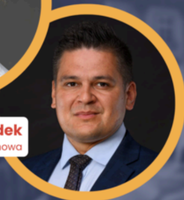
Maciej Włodek Zastępca Prezydenta Tarnowa